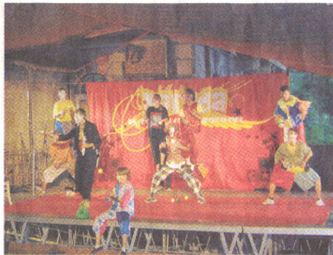
Les acrobates de la fondation Parada ont donné le sourire aux spectateurs.

A noter que le cirque Parada effectue encore deux étapes dans le Sundgau: au-