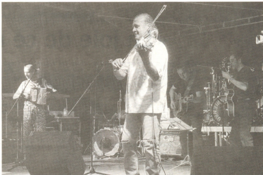
A Bellemagny, lundi soir, le groupe de folk-musette les «O» animera l'apéro-concert en prélude au spectacle de «Parada» et à un film en plein air.

► Lundi 3 juillet , à Bellemagny: apéro-concert à 18h avec de la country music, concert de folk-musette rock