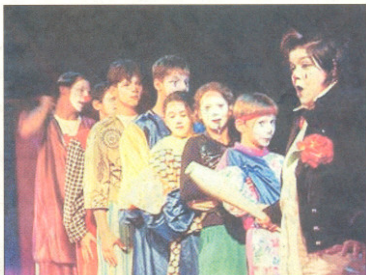
Les jeunes artistes du cirque, venus de Roumanie avec la fondation Parada.

Parada termine sa tournée française par le Sundgau du 3 au 9 juillet. Centrée autour du thème « un nez rouge contre l'indifférence », cette tournée regroupe des artistes de cirque qui ont décidé de soutenir la fondation Parada. Cette dernière, présente en Roumanie, essaye d'accompagner les enfants errant dans les rues de Bucarest.